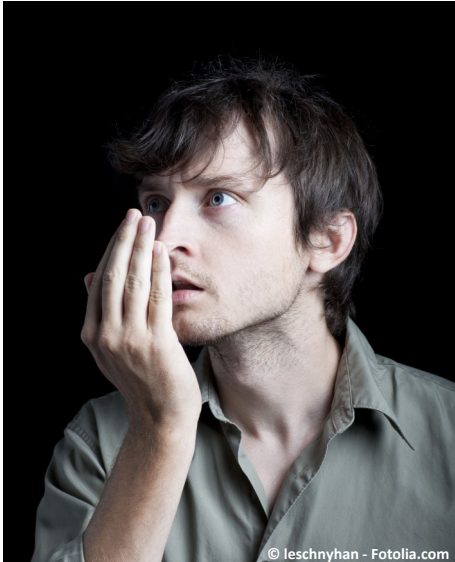
Mundgeruch kann unsicher, gehemmt und einsam machen ...

Fühlen Sie sich manchmal anderen gegenüber gehemmt?