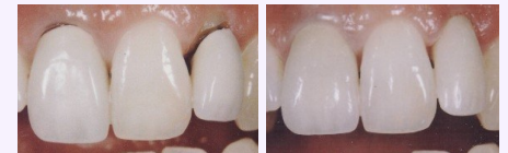
Metallkeramik-Kronen mit dunklen Rändern (links) und ästhetische Kronen aus reiner Keramik (rechts).

Wenn Sie wirklich schöne Zähne wollen, sollten Sie sich für Kronen und Brücken aus reiner Keramik entscheiden.