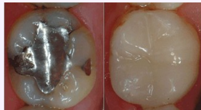
Bedenkliches Amalgam (links) oder verträgliche und ästhetische Füllungen aus Komposit oder Keramik (rechts)?

Als Kassenpatient haben Sie die Wahl zwischen Amalgam und kurzlebigen Kunststoff-Füllungen. Wenn Sie eine dauerhaftere und schönere Lösung wollen, sollten Sie sich für Kompositfüllungen oder für Keramikinlays entscheiden.