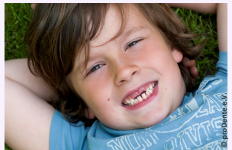
Bei der Prophylaxe lernen Ihre Kinder die richtige Zahnpflege

Es gibt also keinen Grund, warum Sie auf Prophylaxe für Ihre Kinder verzichten sollten.