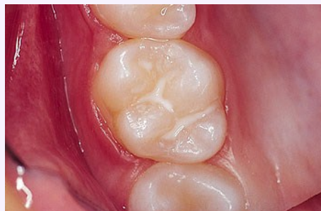
Schutz vor Karies: Versiegelung der feinen Grübchen auf der Kaufläche

Bei der Versiegelung werden die Fissuren mit einem hellen Kunststoff dauerhaft verschlossen, so dass an diesen Stellen keine Karies mehr entstehen kann (siehe Abb. unten).