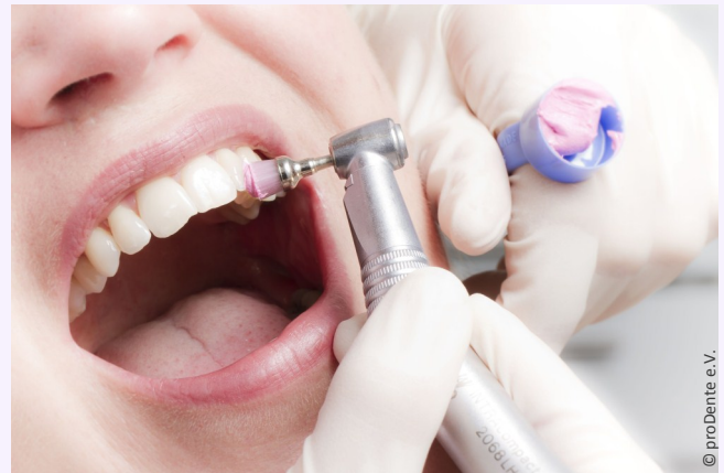
Die Professionelle Zahnreinigung wird von speziell ausgebildeten Prophylaxe-Fachkräften ausgeführt und ist eine lohnende Investition in die eigene Gesundheit.

Sie ersparen sich oft Kronen, Implantate und Zahnfleischoperationen.“