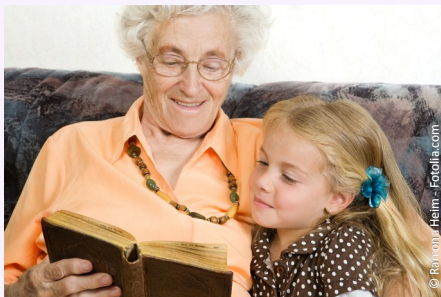
Sicher und unbefangen sprechen mit gut sitzenden Zähnen

Menschen jeden Alters wollen heutzutage aktiv am Leben teilnehmen: In ihrer Familie, im Freundeskreis und bei gesellschaftlichen Anlässen. Dazu gehört auch, dass man sich sicher fühlt beim Essen, Reden und Lachen.