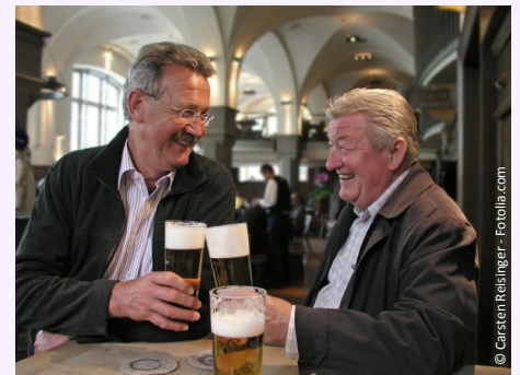
Fest sitzende Zähne: Ein gutes Gefühl!

Stellen Sie sich vor, wie es ist, wenn Sie wieder kraftvoll abbeißen und gut kauen können. Freuen Sie sich an Ihrer neu gewonnenen Sicherheit im Umgang mit anderen Menschen.