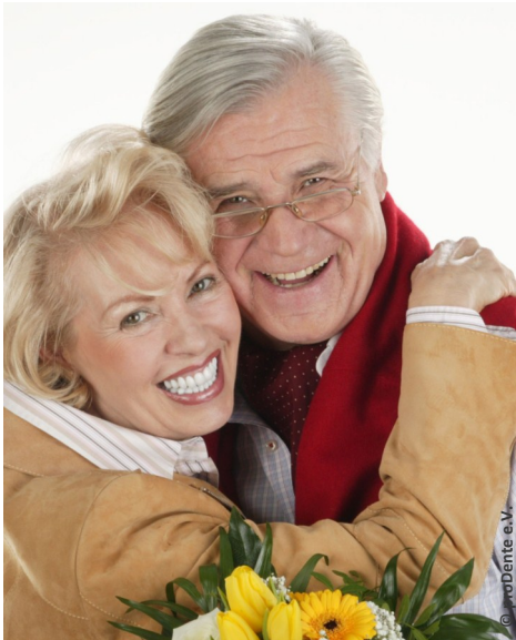
Mehr Lebensfreude und Sicherheit mit Implantaten

Probleme mit schlecht haftenden Zahnprothesen?